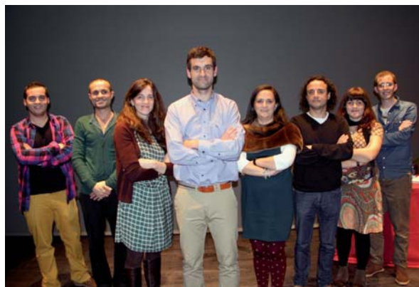
Junta Directiva de la FAXPG.

Mis prioridades como presidente son las aprobadas por los/as ocho miembros que conforman la nueva junta directiva de la FAXPG y que vienen reflejadas en el programa electoral 2012-2016. En dicho programa se establecieron cuatro grupos de interés: Personas Sordas, Sordociegas, con Discapacidad Auditiva y Familias; FAXPG, Fundación FAXPG y Movimien-